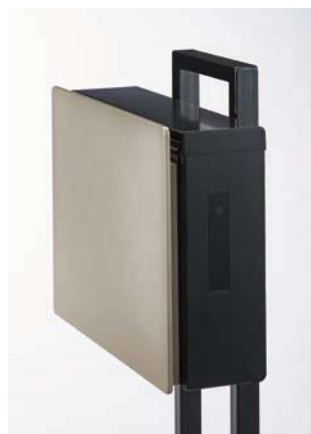
扉を閉めると自動で施錠され電子錠は待機状態に戻ります。