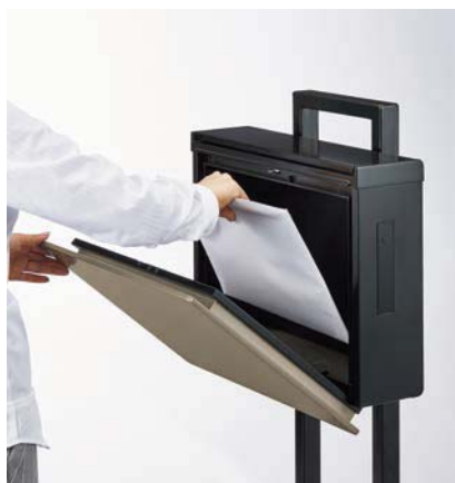
自動で前面の扉が開き、投函物が取り出せます。