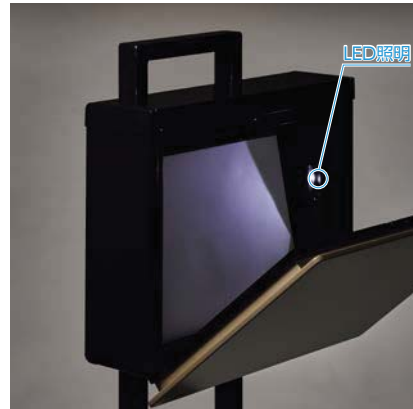
扉が開くと6秒間 自動点灯します。